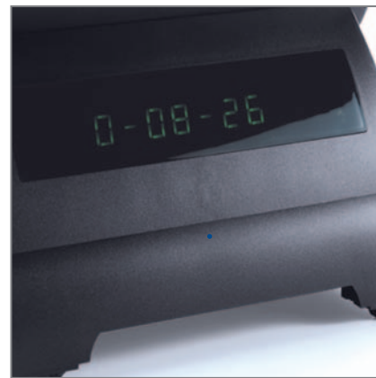
DISPLAY CLIENTE tipo VFD (opzionale)