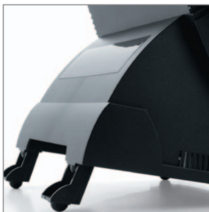
ANGOLO DI INCLINAZIONE VIDEO: 55°/ 65° con piedini regolabili